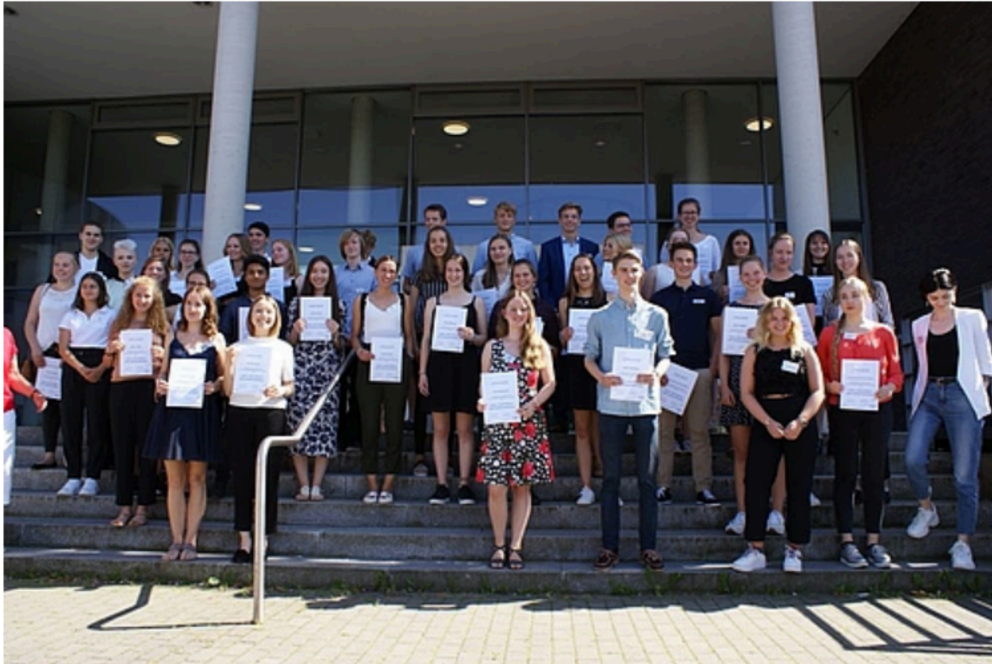
Die Preisträgerinnen und Preisträger vor dem Max-Planck-Institut in Dortmund