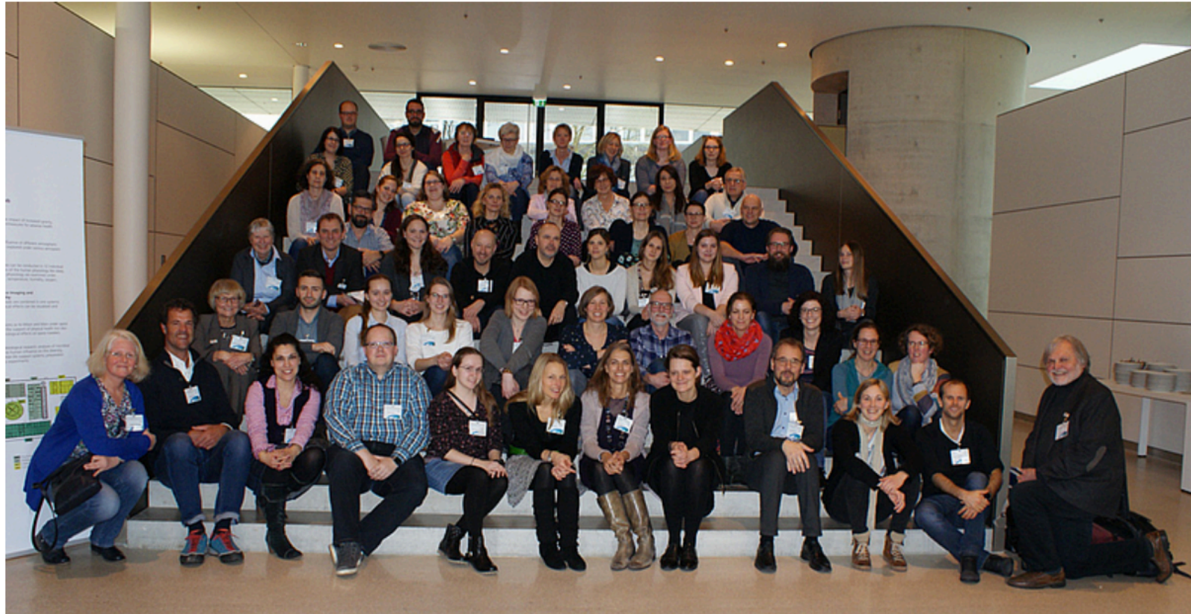
Gruppenbild auf der Freitreppe